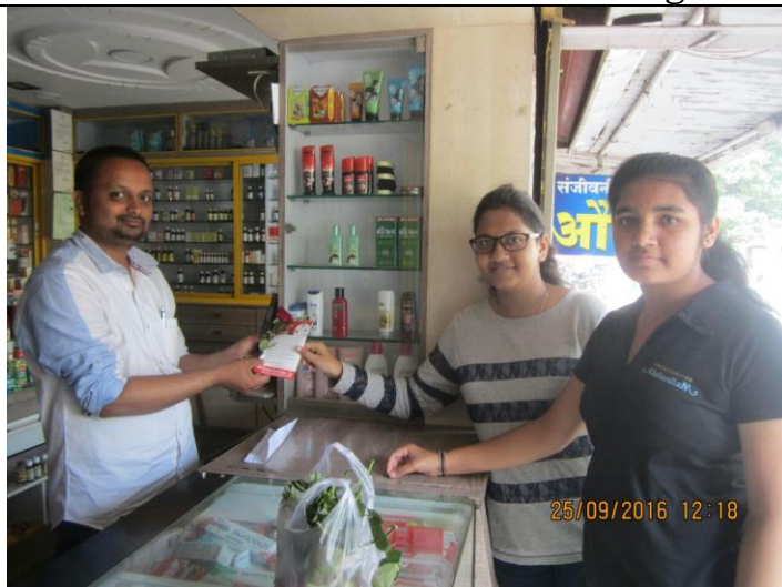
Felicitation of Retail Pharmacist with "Thank You" letter by Alumni Association