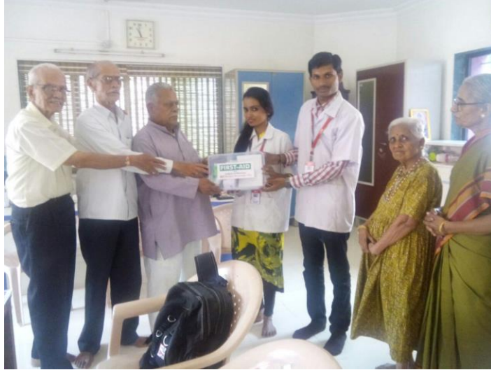
Distribution of First aid box to an old age home