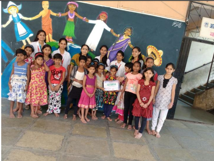
Distribution of First aid box to an orphanage home