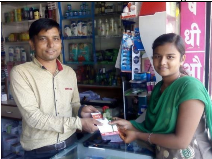
Felicitation of Retail Pharmacist with "Thank You" letter by Alumni Association