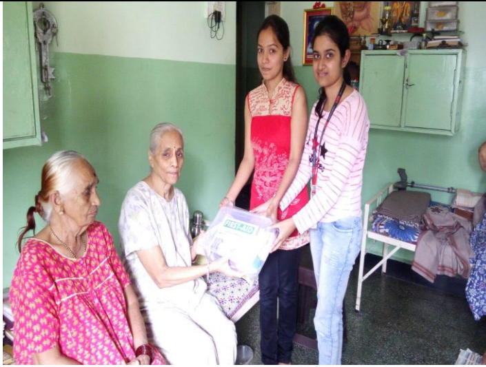
Distribution of First aid box to an old age home