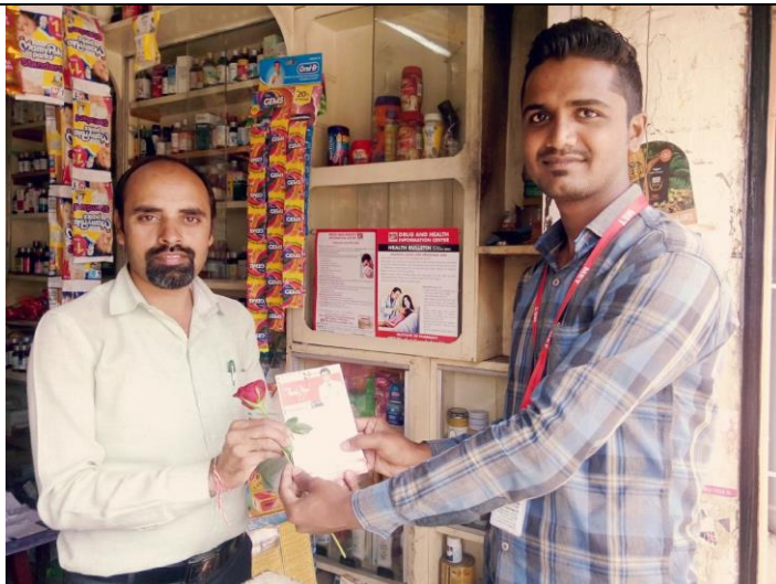
Distribution of Health Bulletin in retail Pharmacy Outlets