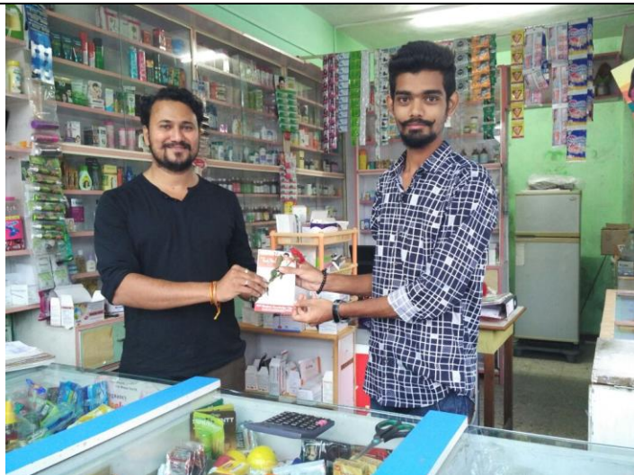
Distribution of Health Bulletin in retail Pharmacy Outlets