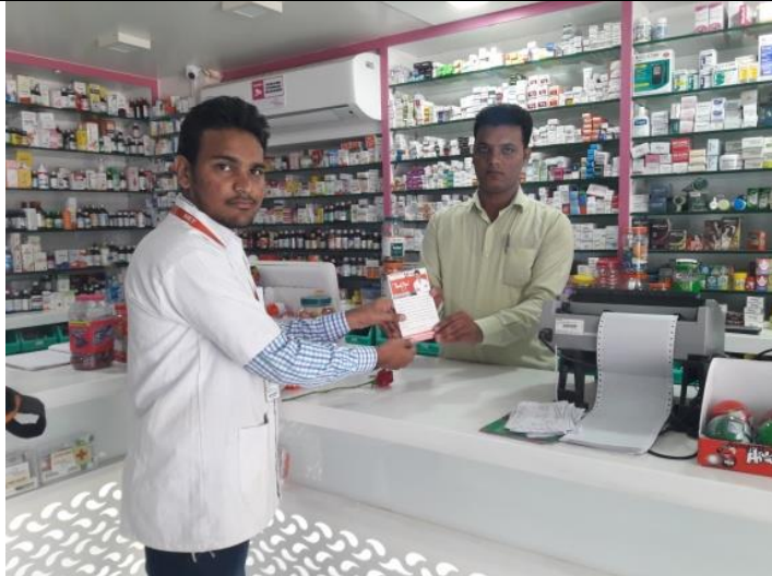
Felicitation of Retail Pharmacist with "Thank You" letter